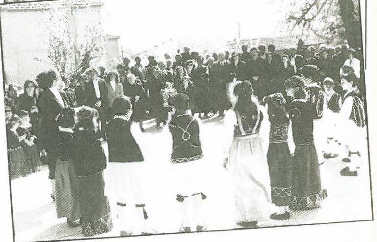
(Επάνω): Όλα τα παιδιά του Δημοτικού Σχολείου και Νηπιαγωγείου Μακρυρραχιάς με τη δασκάλα τους.